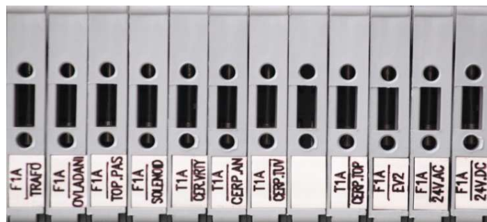
SCHÉMA ROZMÍSTĚNÍ POJISTEK NA OVLÁDACÍM PANELU:

TRAF0 – F1A OVLÁDÁNÍ – F1A TOPNÝ PÁS – F1A SOLENOID – F1A ČERPADLO VRTY - T1A ČERPADLO AKUMULAČNÍ NÁDRŽ - T1A ČERPADLO TUV - T1A ČERPADLO BAZÉN - T1A ČERPADLO TOPNÝ SYSTÉM – T1A VSTŘIKOVACÍ VENTIL EV2 – F1A NAPÁJENÍ 24V AC - F1A NAPÁJENÍ 24V DC - FT1